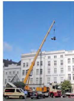
Spektakuläre Anlieferung: Für Arbeiten im Innenhof der Lübecker Altstadt Häuser werden Maschinen von HKL per Kran an ihren Einsatzort transportiert.