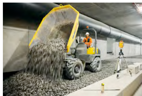
Ein Dumper von HKL transportiert den für die Gleisanlage benötigten Schotter und kippt ihn auf den jeweiligen Abschnitten ab