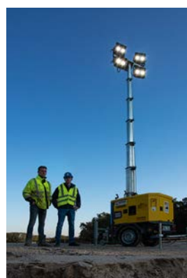
Insgesamt drei LED Lichtmaste HiLight H5+ aus dem HKL MIETPARK sorgen für ausreichend Helligkeit.