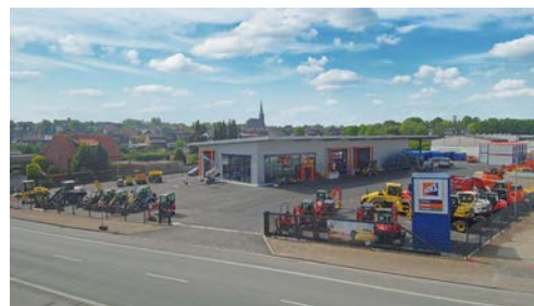
Das neue HKL Center Hamm an der Römerstraße 109a bietet eine größere Maschinenauswahl und noch mehr Service für NRW.