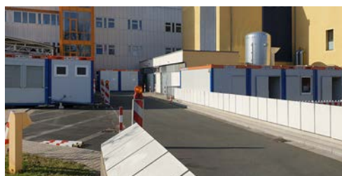
Zehn HKL Raumsysteme entlasten die Eingangssituation der Notaufnahme des Klinikums Fürth.